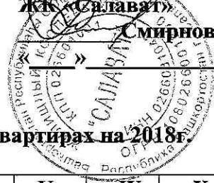
График Проф. осмотра сантехоборудования в квартирах на 2018г.